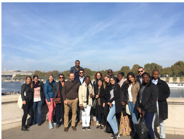
Organisation du pré-colloque.

Cette année, pour EMF2018 à Paris, nous avons proposé à nouveau ce projet spécial et nous avons accueilli 14 jeunes enseignants des pays suivants : Belgique (1), Côte d'Ivoire (2), France (3), Mali (2), Maroc (2), Québec (2), Sénégal (1) et Suisse (1).