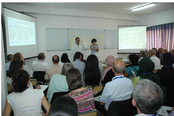
Groupe de travail durant la conférence CIEAEM 70

Mais l'activité de la CIEAEM ne s'arrête pas ! La prochaine conférence (CIEAEM 71) est déjà prévue et se déroulera à Braga (Portugal) du 22 au 26 juillet 2019 et portera sur « Connexions et compréhension dans l'enseignement des mathématiques : donner un sens à un monde complexe ».