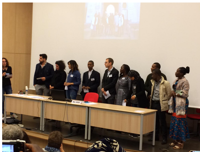
Membres du Projet jeunes en séance de clôture

Enfin, quatre sessions traitant de cinq "projets spéciaux" (en parallèle) ont complété ce riche programme : SPE1 : Projet jeunes (voir le compte rendu dans l'article suivant). SPE2 : Transitions dans l'enseignement des mathématiques. SPE3 : évaluation. SPE4 : Travail collaboratif. SPE5 : Mathématiques et informatique.